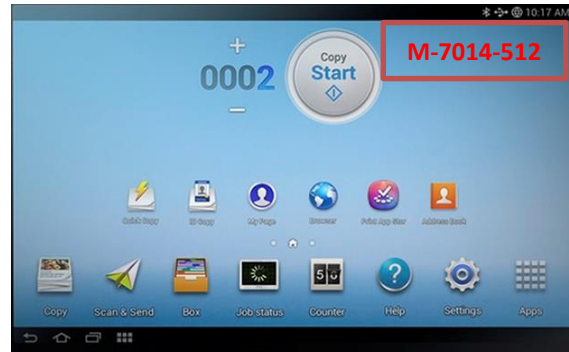
4.2 รูปถ่าย ERROR CODE ที่ปรากฏบนหน้าจอแสดงผล